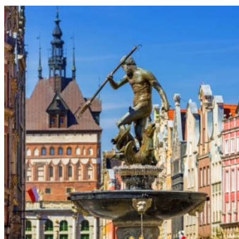
Pomnik Neptuna na starówce