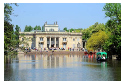
Pałac na wodzie w Łazienkach