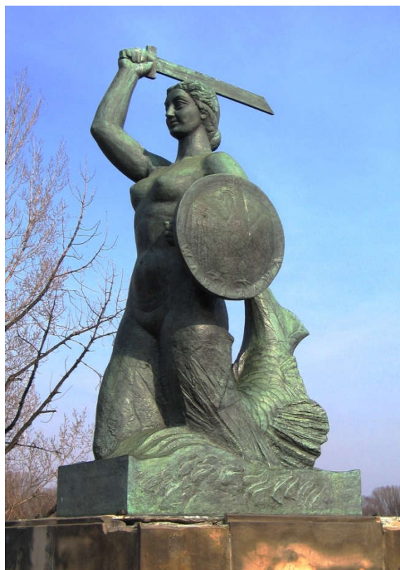
To pomnik syrenki nad Wisłą

Warszawa jest stolicą Polski, to znaczy największym i najważniejszym miastem. Herbem Warszawy jest oczywiście syrenka. Jedna z legend mówi o tym ,że kiedyś syrenka żyła w Wiśle i śpiewała pięknie rybakom, którzy łowili tam ryby w sieci. Ale kiedyś jeden kupiec chciał ją porwać, sprzedać i zarobić dużo pieniędzy. Wtedy uratowali ją rybacy, a syrenka z wdzięczności obiecała, że będzie ich zawsze chronić i bronić. To dlatego warszawska syrenka w dłoniach trzyma miecz i tarczę. Warszawiacy postawili jej pomnik, jeden z nich stoi nad Wisłą, a drugi? ..... ( może wiecie?)