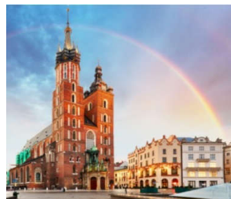
Kościół Mariacki i rynek

Rozruszajmy się ze smokiem w rytm piosenki