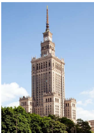
Pałac Kultury i Nauki