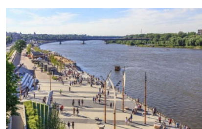
Bulwary nad Wisłą