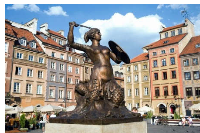
A to Syrenka na rynku Starego Miasta