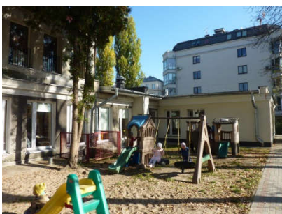
Poznajecie? – tak to nasze przedszkole i wasze zabawy w ogródku