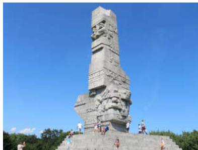
Pomnik na Westerplatte