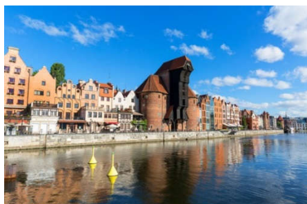
Żuraw w Gdańsku