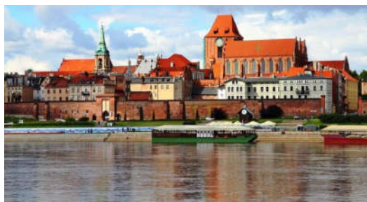
Toruń widziany od strony Wisły