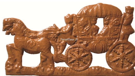
Piernik w kształcie karocy